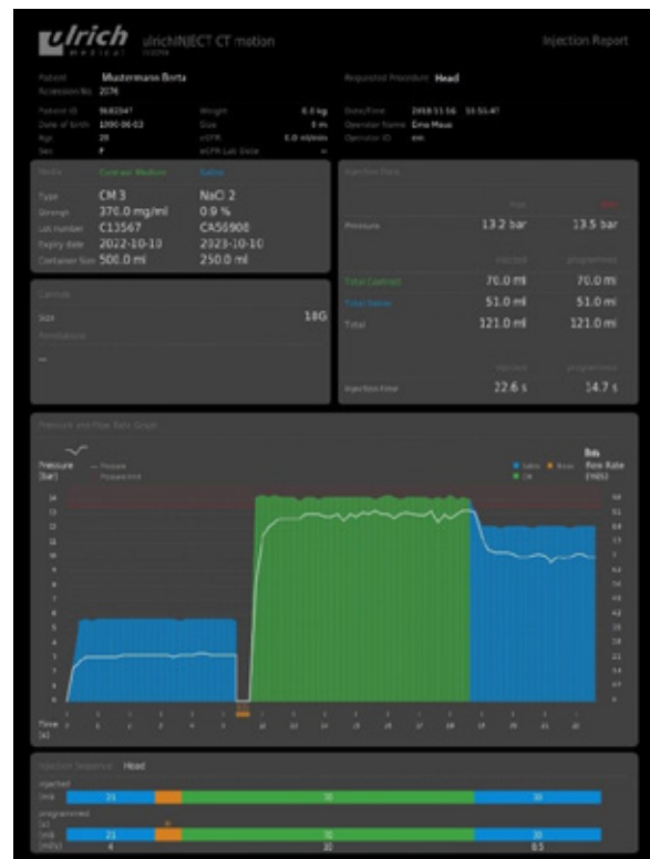
CM Dose Report als DICOM SC-Image