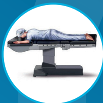
Patient:in in Bauchlage