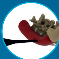
Position des GHOST-Retraktors durch den Psoasmuskel