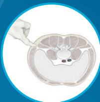
Sicherer Korridor durch den Psoasmuskel zur Lendenwirbelsäule